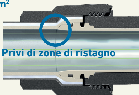
JRG Sanipex MT