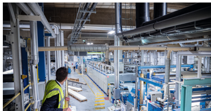
Les systèmes de tuyauterie COOL-FIT ont pu être installés sans interrompre la production de masques.

Téléphone +41 (0)52 631 11 11 mail@georgfischer.com www.gfps.com