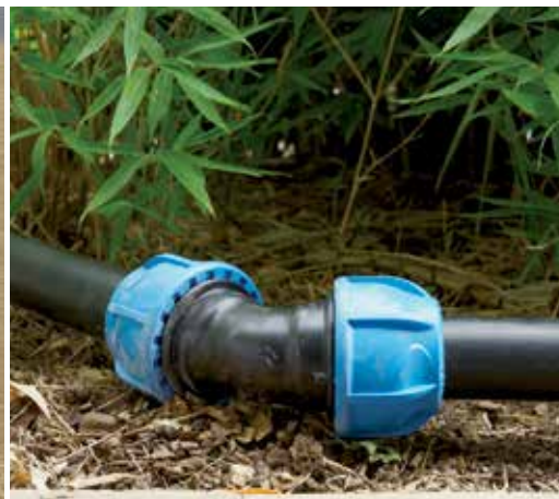
Irrigazioni di notevole portata