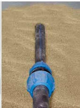
Allacciamenti per uso domestico