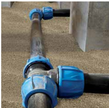
Condutture di distribuzione acqua

Il sistema iJOINT è progettato per essere utilizzato negli allacciamenti e nelle condutture per uso civile. Questo sistema polivalente si presta a nuove installazioni, ma anche a lavori di ristrutturazione o ampliamento di condutture dell'acqua esistenti. Il sistema iJOINT può essere utilizzato per applicazioni di diverso genere e il suo design offre vantaggi per molti settori. Inoltre iJOINT rappresenta la soluzione perfetta per i sistemi bypass in cui è necessario disassemblare condutture installate temporaneamente in modo semplice e rapido.