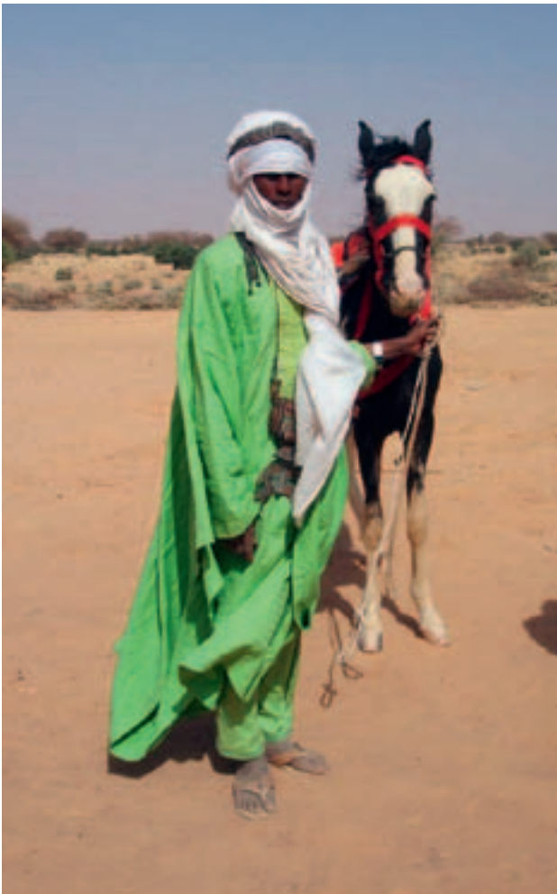
Niger (2010): Finanzierung von zwei Brunnen in Abala; Projektpartner: Swissaid.