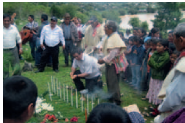
Mexiko (2011): Vorbereitungen für den Bau der Wasserleitung im Indianerdorf La Floresta. Projektpartner: Schweizerische Indianerhilfe SIH / ASI.