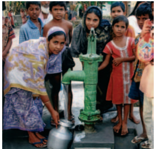
Indien (2007); Projektpartner: Mass Education (Indien).