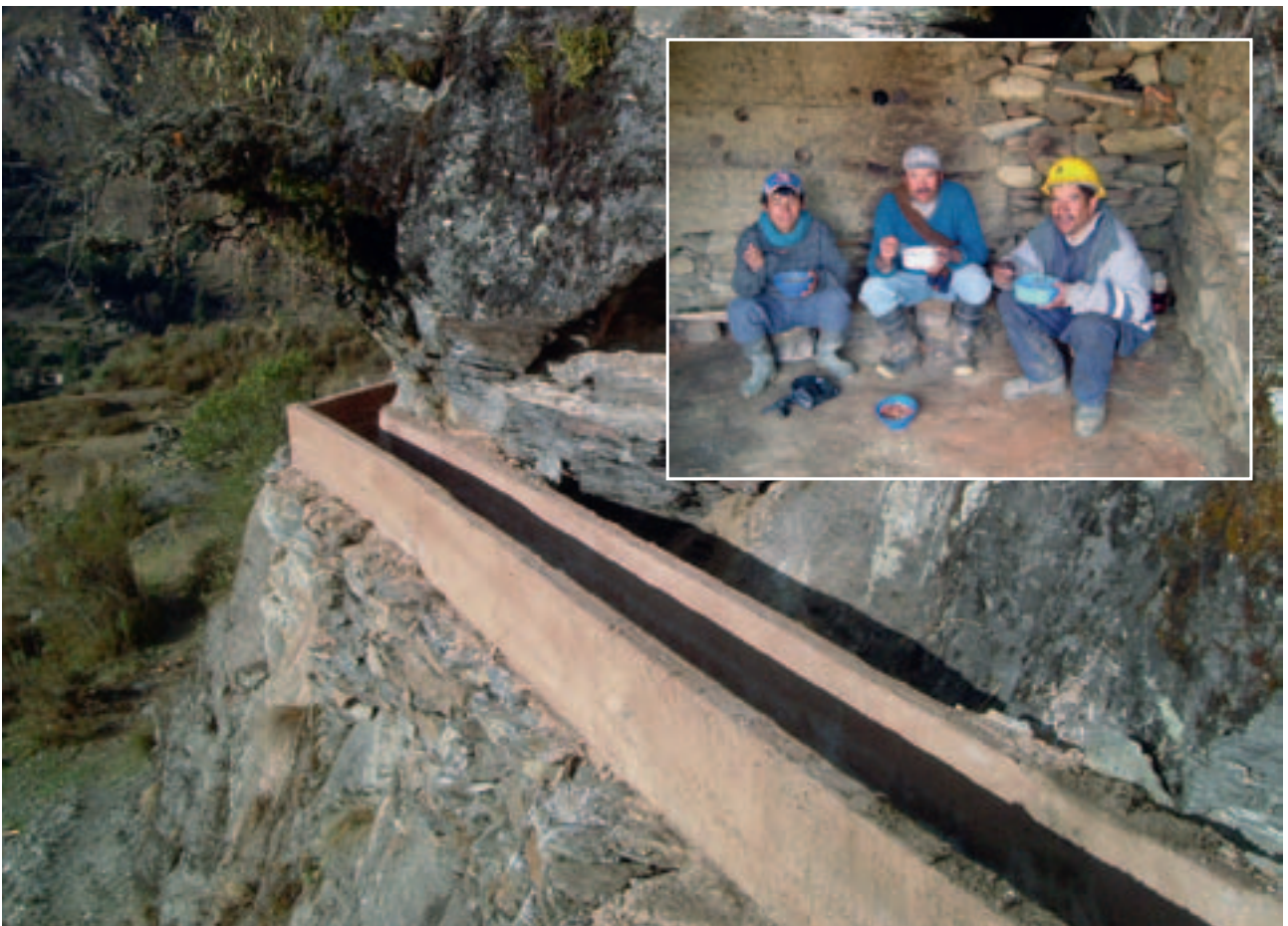
Peru (2005): Bau der Wasserleitung vom Bergsee zum Dorf Uco; Projektpartner: Mission Don Bosco (Italien).