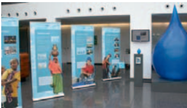
Mettmann (2008): Wanderausstellung von «Clean Water» zu Besuch in unserer grössten Giesserei in Deutschland. Das Interesse der Mitarbeitenden an der Stiftung ist gross.

In tendenziell städtischen Gebieten unterstützen wir vor allem einzelne soziale Institutionen wie Spitäler, Waisenhäuser und Schulen (Internate). «Clean Water» hilft dabei vor allem dort, wo der Staat nicht existent oder nicht fähig ist, die Grundbedürfnisse der eigenen Einwohner zu decken. Diese Situation trifft teilweise auch auf Europa zu,