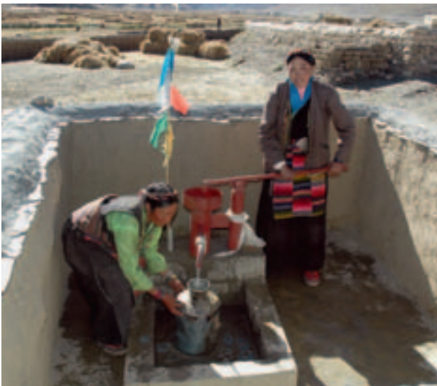
Dank der neuen Gemeinschaftswasserpumpe in Lhaton gehören die kilometerweiten Fussmärsche zur nächsten Wasserstelle der Vergangenheit an.