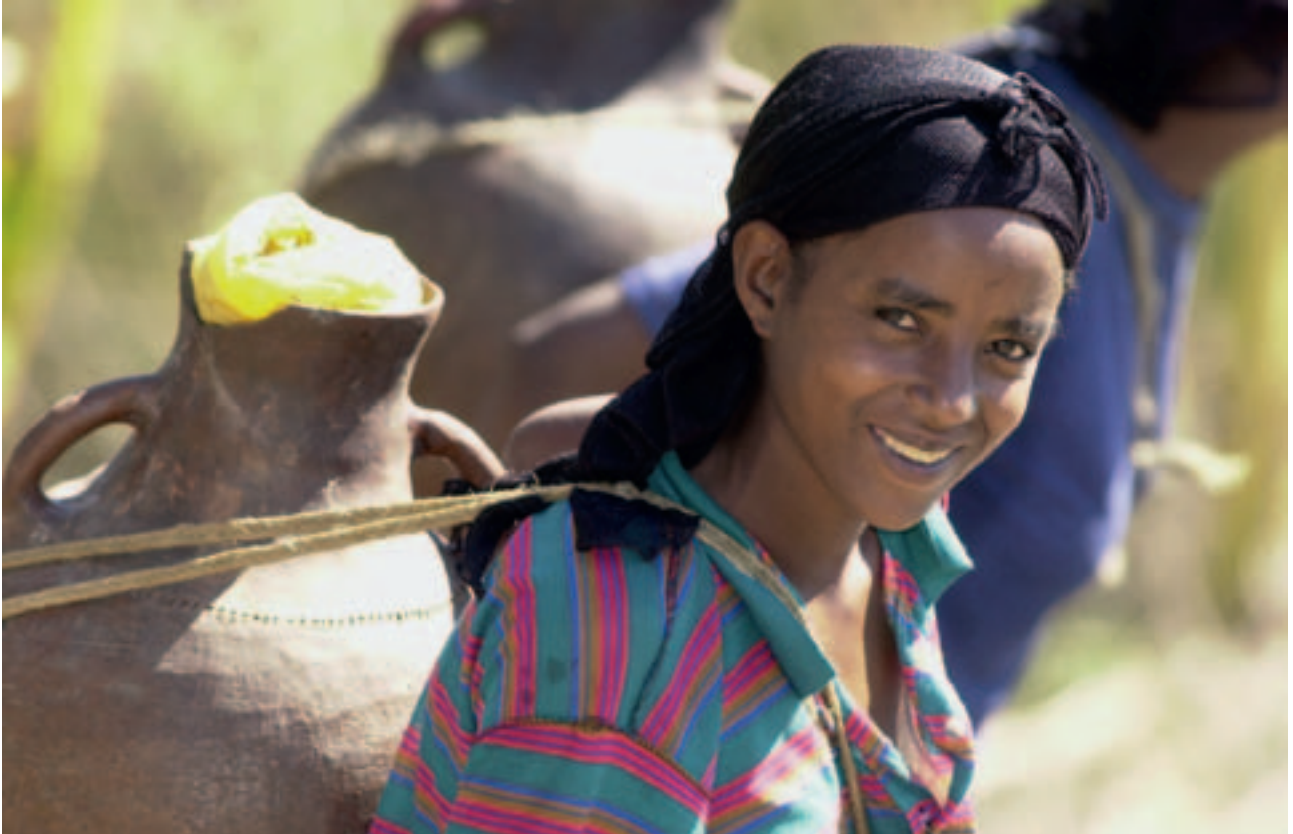
Äthiopien (2003); Projektpartner: Menschen für Menschen.

Das nachhaltige Jubiläumsgeschenk der Georg Fischer AG zur 200-Jahr-Feier