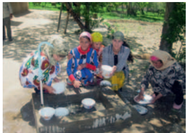
Tadschikistan (2010): Bau einer Trinkwasserversorgung für drei ländliche Dörfer; Projektpartner: Caritas Schweiz.