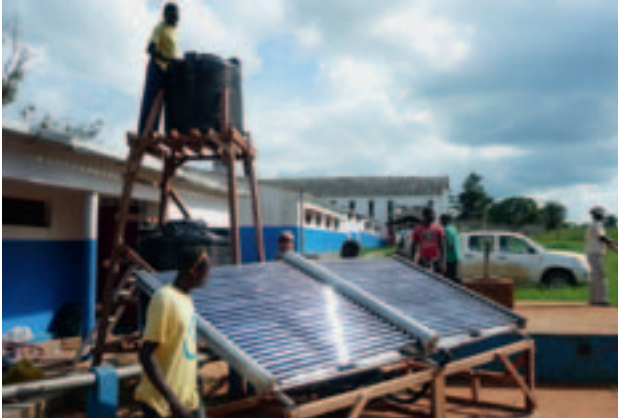
Mocambique (2011): Aufbau eines Swiss Wasserkiosks. Projektpartner: Fachhochschule Rapperswil (Schweiz).