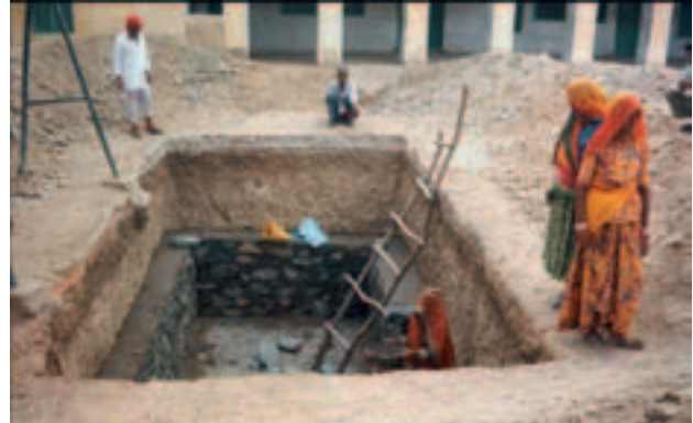
Sikkim (2005): Der Bau von Regenwasserauffangbecken bildet einen der Schwerpunkte von «Clean Water». Projektpartner: Barefoot College (Indien).

Etwa zwei Drittel aller Projekte realisieren wir mit oft langjährigen Partnern, etwa ein Drittel der Projekte vergeben wir jährlich an neue Partner. Bei Anfragen über Internet