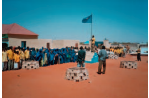
Somalia (2007): Einweihung der Wasserversorgung im Spital von Abudwaak. Projektpartner: Hadia Medial Swiss Somalia (CH – Somalia).