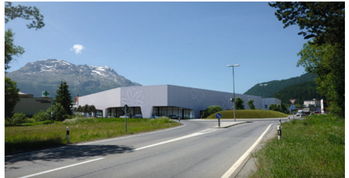
COOL-FIT 4.0 reduziert den Energieverbrauch für Heizung und Kühlung.

Telefon +41 (0)52 631 11 11 mail@georgfischer.com www.gfps.com